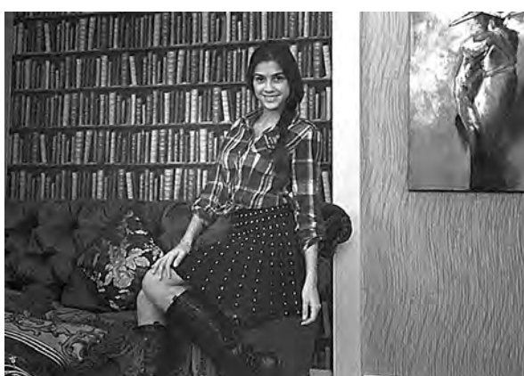
Олеся победила и в интернет-голосовании.