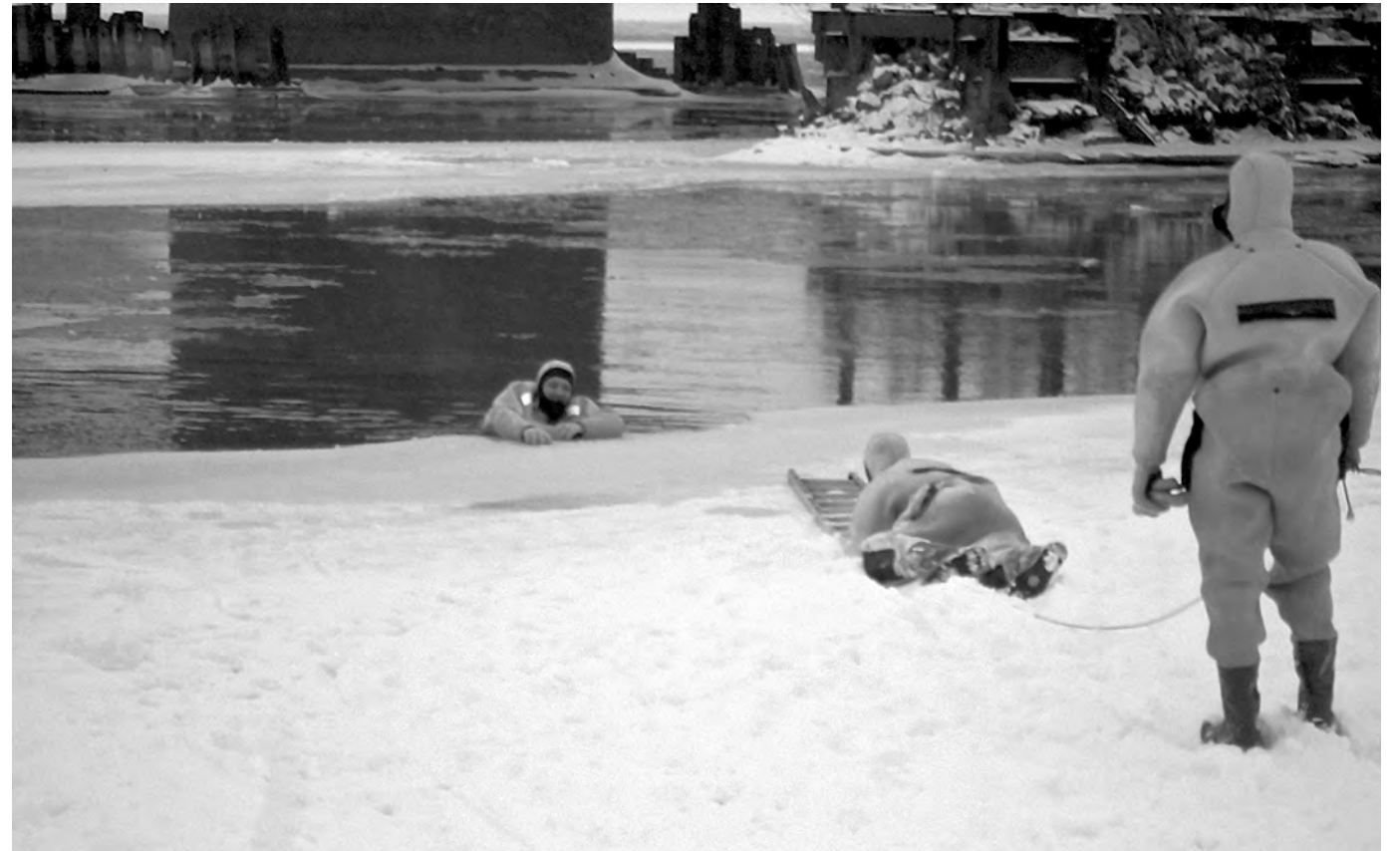
■ СПАСЕНИЕ НА ЛЬДУ. В Новокузнецке, в связи с массовыми выходами на неокрепший лед любителей зимней рыбалки, местные спасатели в районе Кузнечного моста проводили тренировку по спасению людей, якобы провалившихся под лед. Помимо прочего спасатели тренировались оказывать помощь пострадавшим, используя подручные средства (не приспособленные для спасения) и выполняли элементы самоспасения. Тренировка сопровождалась рядом опасностей: неокрепший лед в любой момент мог треснуть под тяжестью лодки, а льдина перевернуться и накрыть сверху.