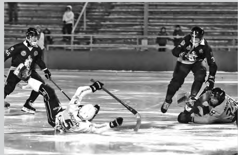
Пока «Кузбассу», даже защищающемуся «числом», умения отстоять свои ворота хватает не всегда...