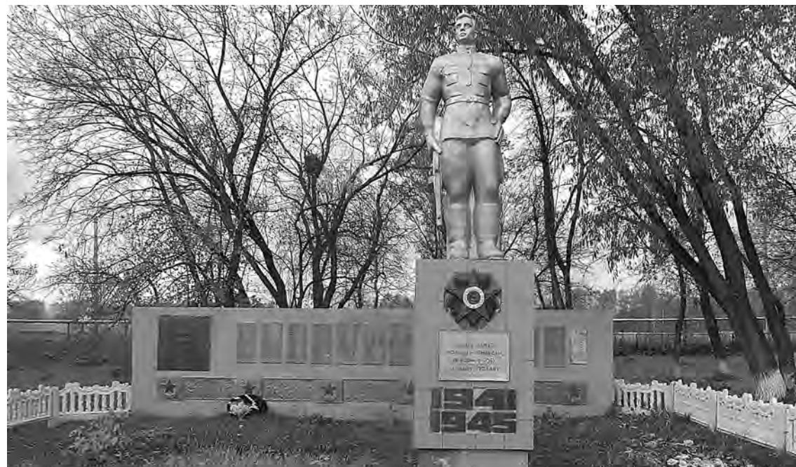
Памятник в п. Рассвет Соломинского поселения Топкинского района в честь местных жителей, погибших в Великую Отечественную войну.